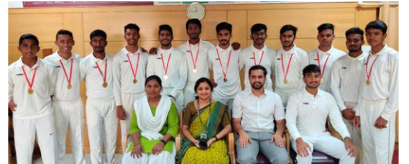
Winners in Bangalore University Inter-College Cricket T-20 Tournament 2019-20.