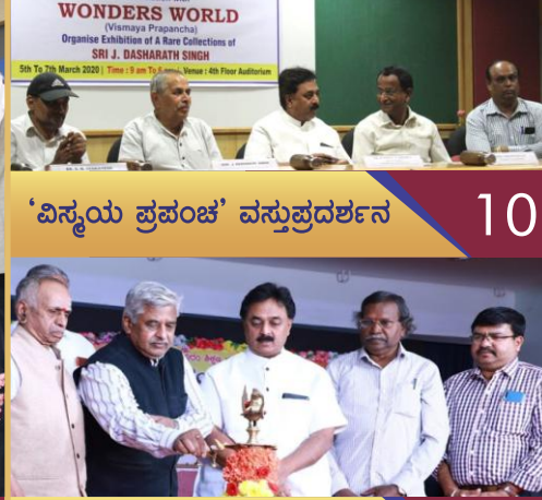
'ವಿಸ್ಮಯ ಪ್ರಪಂಚ' ವಸ್ತುಪ್ರದರ್ಶನ