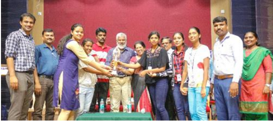
Winners in Bengaluru Central University Inter-Collegiate Chess Women's Championship.