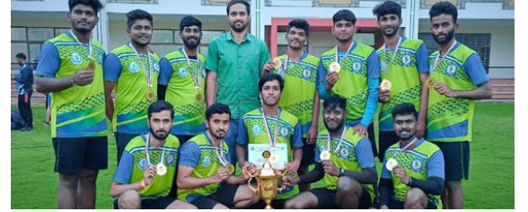
Winners of SPORTSTAKES 2020 - St. Joseph's Throwball Men's Competition.