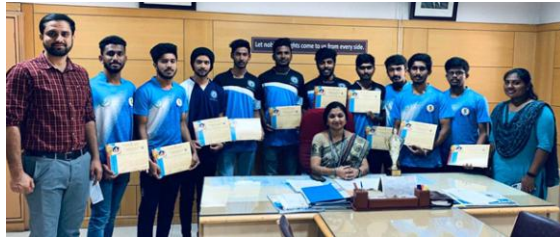
Winners in Bangalore University Inter-Collegiate Floorball Men's Competition 2019-20.