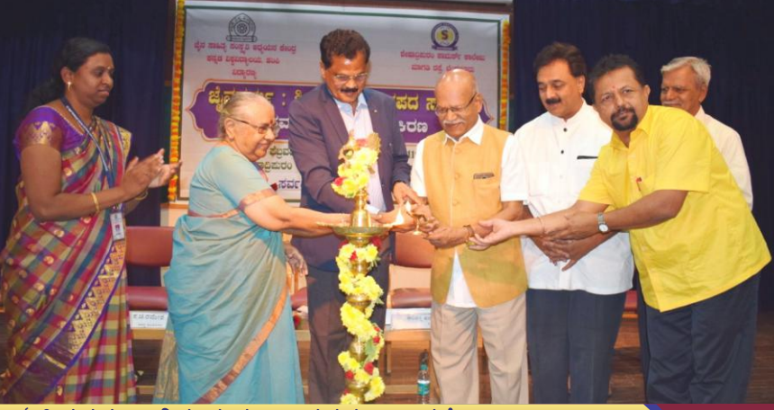
'ಜೈನಧರ್ಮ: ಶಿಷ್ಟ ಮತ್ತು ಜಾನಪದ ಸಾಹಿತ್ಯ' ರಾಷ್ಟ್ರಮಟ್ಟದ ವಿಚಾರ ಸಂಕರಣ

ಶೇಷಾದ್ರಿಪುರಂ ಶಿಕ್ಷಣ ದತ್ತಿ ಶೇಷಾದ್ರಿಪುರಂ, ಬೆಂಗಳೂರು-560020 www.set.edu.in | info@set.edu