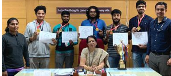
Winners in Bangalore University Inter-Collegiate Table Tennis Men's Championship 2019-20.