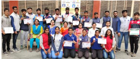
20 Students participated in Throwball, Weightlifting, Netball, Wrestling and Handball competitions and secured 2 gold medals, 3 silver medals 5 bronze medals in various games.