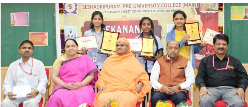
On 6 Jan. 2020, Vivekananda Study Centre, SPUC, Main College organised a Speech Competition on the occasion of Swamy Vivekananda Jayanthi.

“ವರುಷಕೊಂದು ಹೊಸತು ಜನ್ಮ ವರುಷಕೊಂದು ಹೊಸತು ನೆಲೆಯು ಅಖಿಲ ಜೀವಜಾತಕೆ, ಒಂದೇ ಒಂದು ಜನ್ಮದಲ್ಲಿ ಒಂದೇ ಬಾಲ್ಯ ಒಂದೇ ಹರಯ ನಮಗದಷ್ಟೆ ಏತಕೋ ನಿಧ್ವಗೊಮ್ಮೆ ನಿತ್ಯ ಮರಣ ಎದ್ದ ಸಲ ನಖಿನ ಜನನ ನಮಗೆ ಏಕೆ ಬಾರದೋ” – ದ.ರಾ. ಬೇಂದ್ರೆ