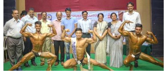
Winners of Best Poser, Mr. Bengaluru Central University and Most Muscular 2019-20.