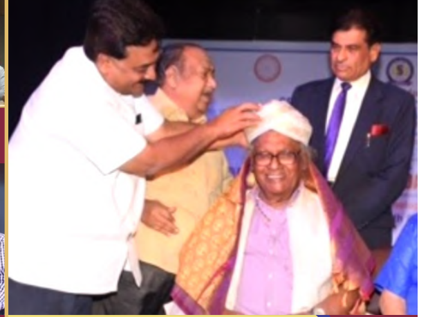
National Science Day 2020