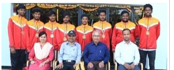
On 11 & 12th Jan. 2020, the Throwball Men's Team of SFGC, Yelahanka won the Throwball Championship at the National Games organised by Students All Games Activities Development Foundation, Mysore,