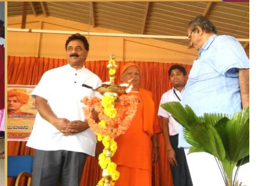
ಯುವಜನ ಜಾಗೃತಿ ಸಮ್ಮೇಳನ 2019-20