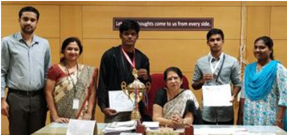
Winners in Bangalore University Inter-Collegiate Boxing Men's Championship 2019-20.