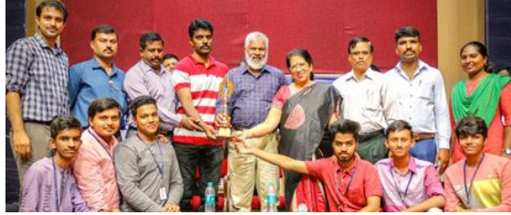
Winners of the Bengaluru Central University Inter-Collegiate Chess Men's Championship 2019-20.