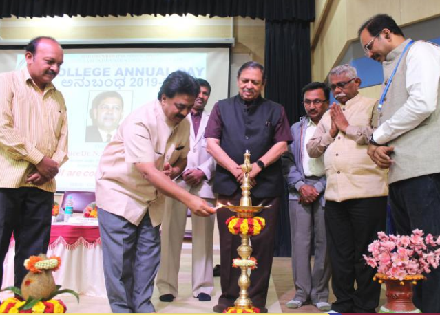
ಕಾಲೇಜು ವಾರ್ಷಿಕೋತ್ಸವ-'ಅನುಬಂಧ 2019'