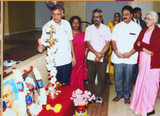
Mahatma Gandhi's 150th Birth Anniversary