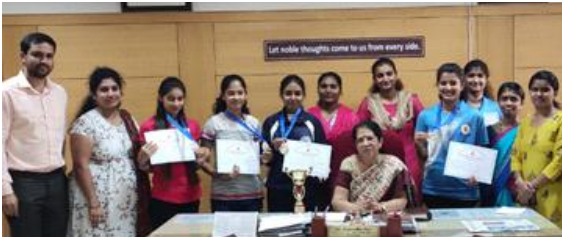
Runners-up in Bengaluru Central University Table Tennis Women's Championship 2019-20.