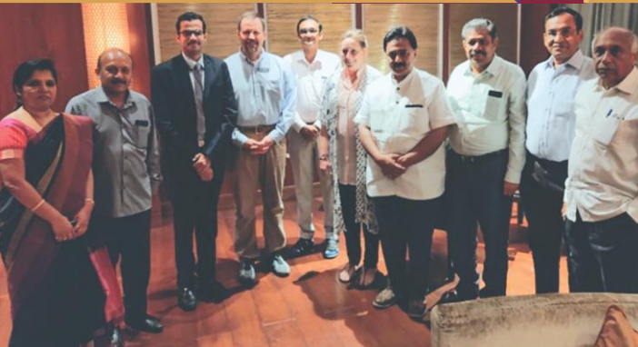
Seshadripuram Academy for Global Excellence (S.A.G.E.)