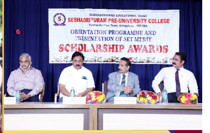
ಪ್ರತಿಭಾ ಪುರಸ್ಕಾರ ಸಮಾರಂಭ