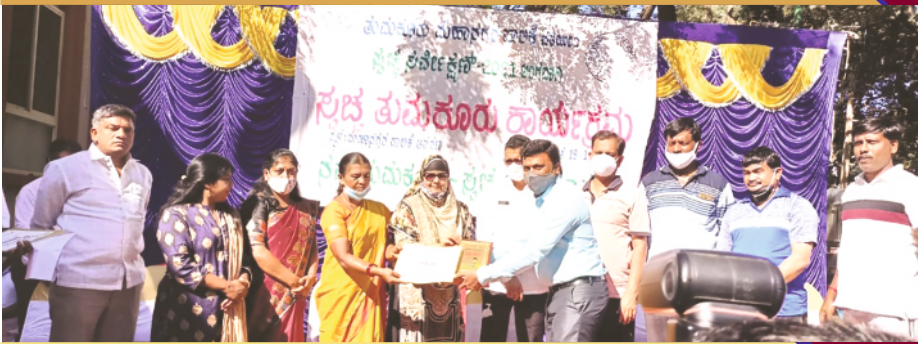
"ಸ್ವಚ್ಛ ಶಾಲೆ" ಪುರಸ್ಕಾರ