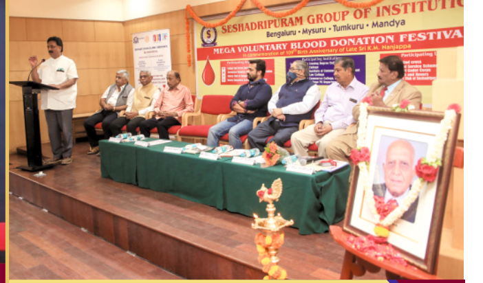
S.E.T. Mega Voluntary Blood Donation Festival