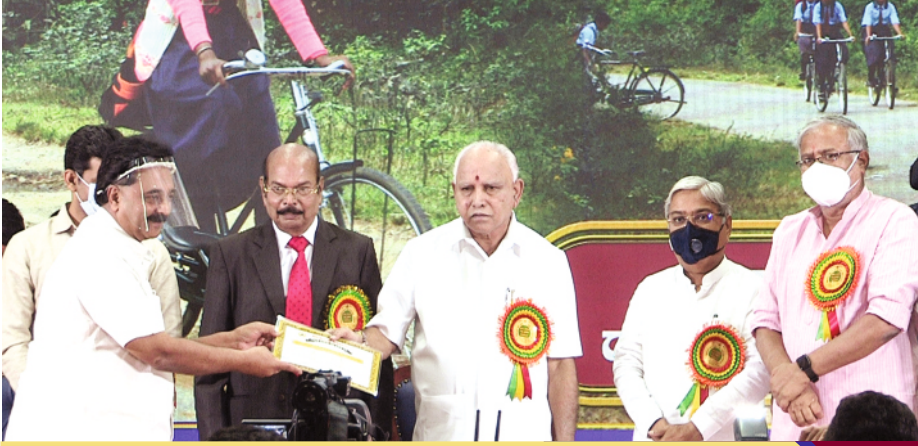
Adoption of Govt. Schools