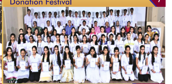
ಉಚಿತ ಶಿಕ್ಷಣ ಪ್ರೋತ್ಸಾಹ