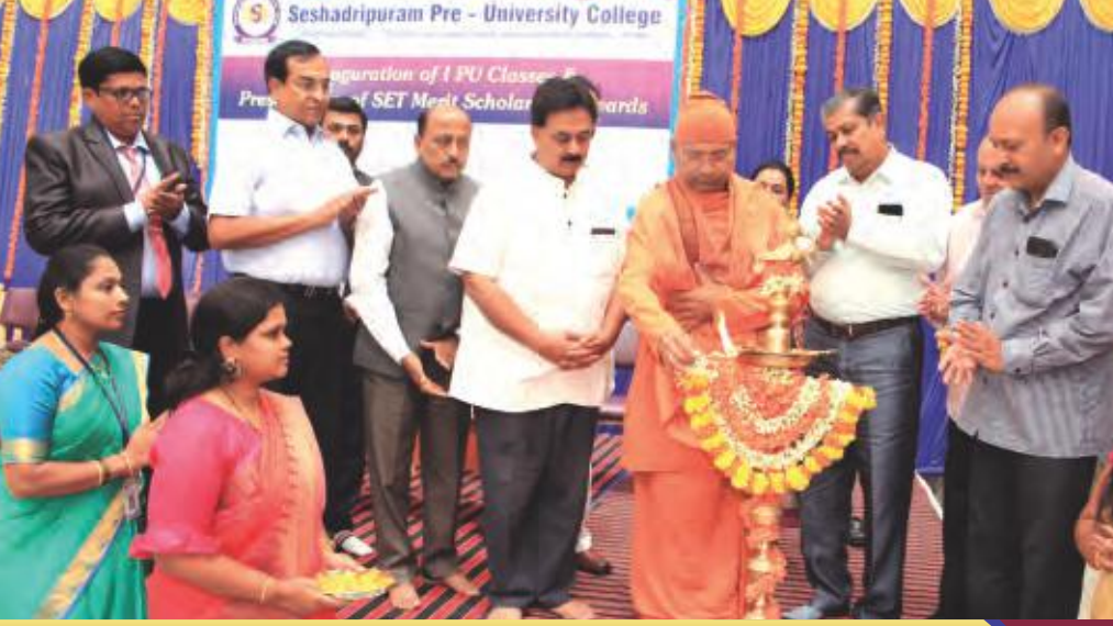
ಎಸ್.ಇ.ಟಿ. ಪ್ರತಿಭಾ ಪುರಸ್ಕಾರ ಮತ್ತು ಪದವಿ ತರಗತಿಗಳ ಉದ್ಘಾಟನಾ ಸಮಾರಂಭ

ಶೇಷಾದ್ರಿಪುರಂ ಶಿಕ್ಷಣ ದತ್ತಿ ಶೇಷಾದ್ರಿಪುರಂ, ಬೆಂಗಳೂರು-560020 www.set.edu.in | info@set.edu