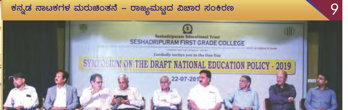
Symposium on, "The Draft National Education Policy-2019"