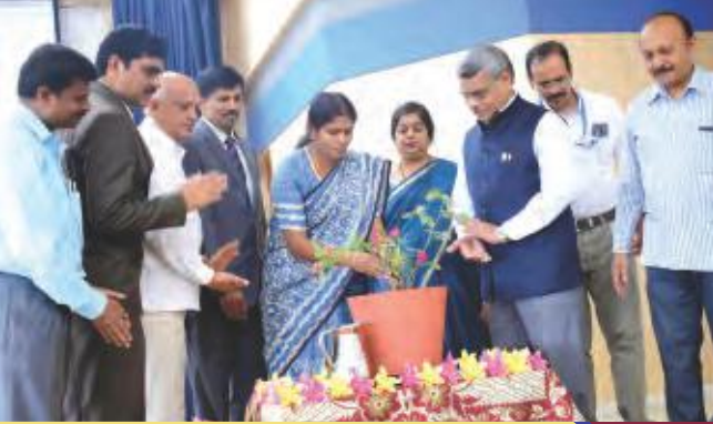
ಪರಿಸರ ಸ್ನೇಹಿ ಗಣೇಶ ಮೂರ್ತಿ ತಯಾರಿಕಾ ತರಬೇತಿ