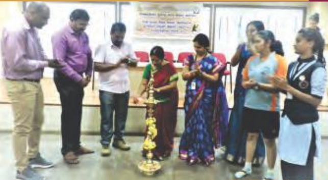
District Level Inter-Collegiate Sports Meet