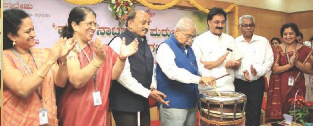
ಕನ್ನಡ ನಾಟಕಗಳ ಮರುಚಿಂತನೆ - ರಾಜ್ಯಮಟ್ಟದ ವಿಚಾರ ಸಂಕರಣ