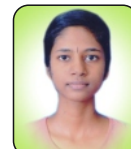
APSARA B 585 / 14th Place PCMB, 97.50%