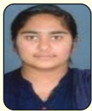
SRUSTI A 457 - 91.40% EBAC - 10th Place