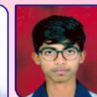
AMARTHYA .R 94 %