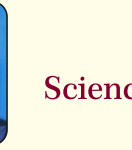
C M YUKTHA 578-PCMC-21st Place